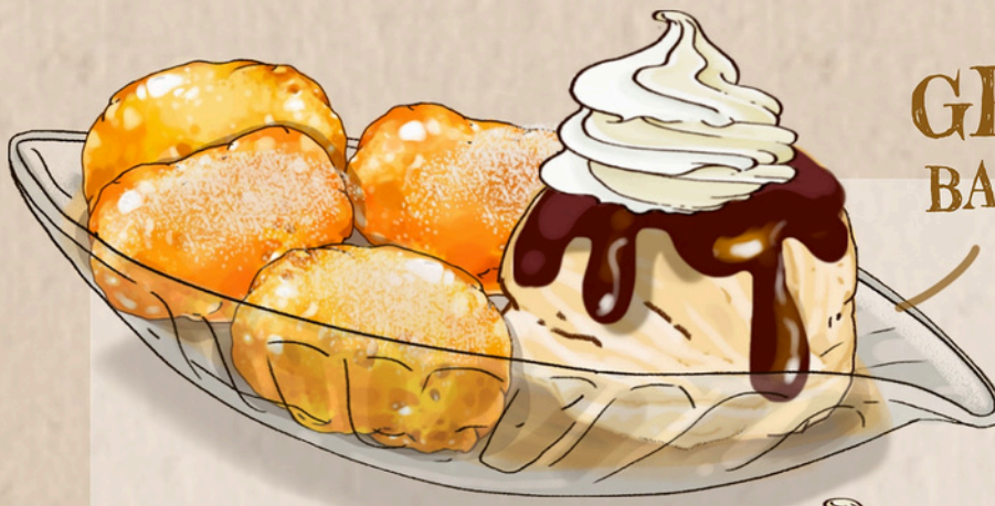
GEBACKENE BANANEN MIT EIS 7,50