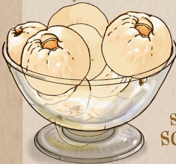
DREI SORTEN EIS MIT SAHNE UND SCHOKOSOßE 6,50